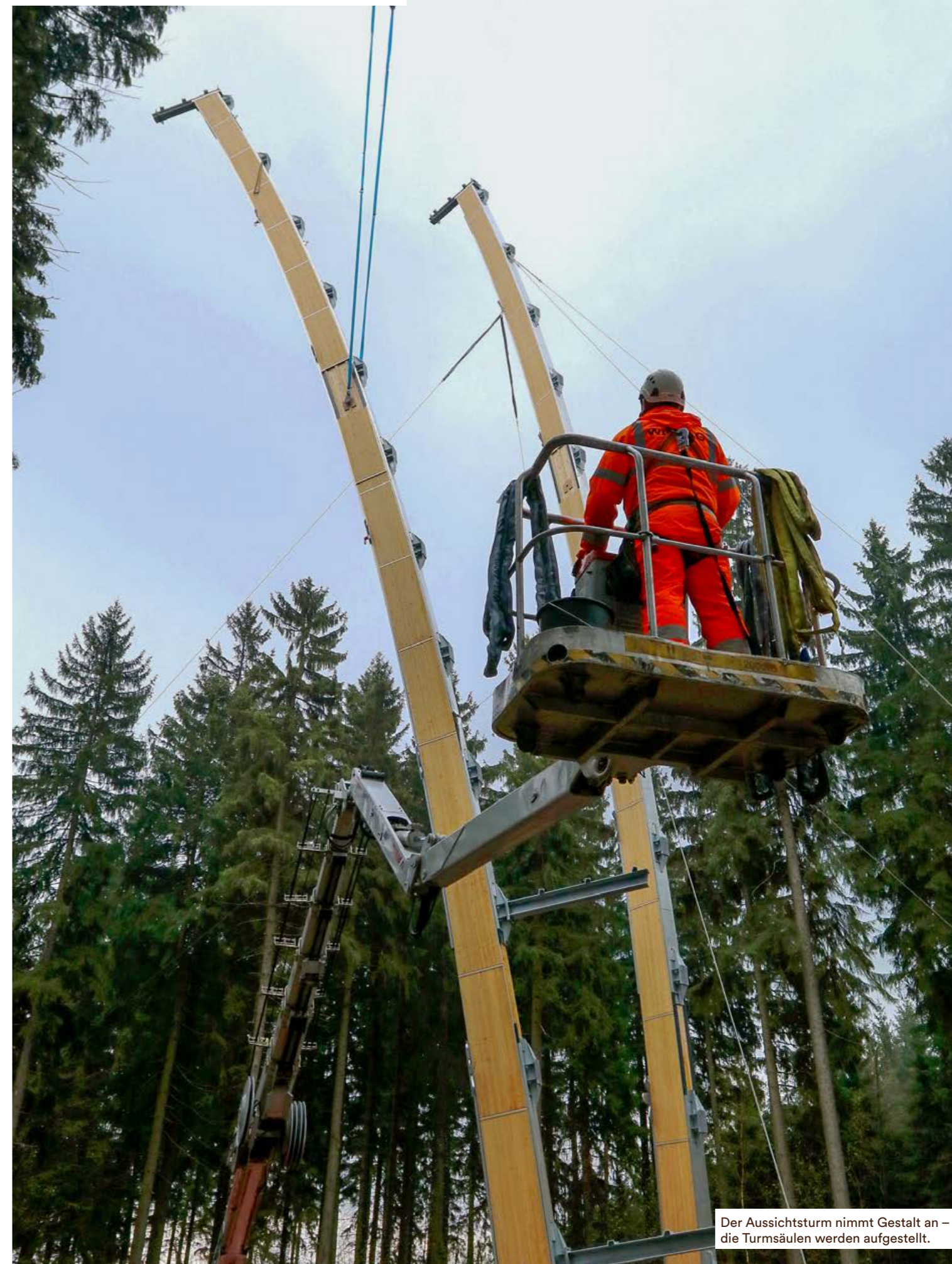
Der Aussichtsturm nimmt Gestalt an – die Turmsäulen werden aufgestellt.