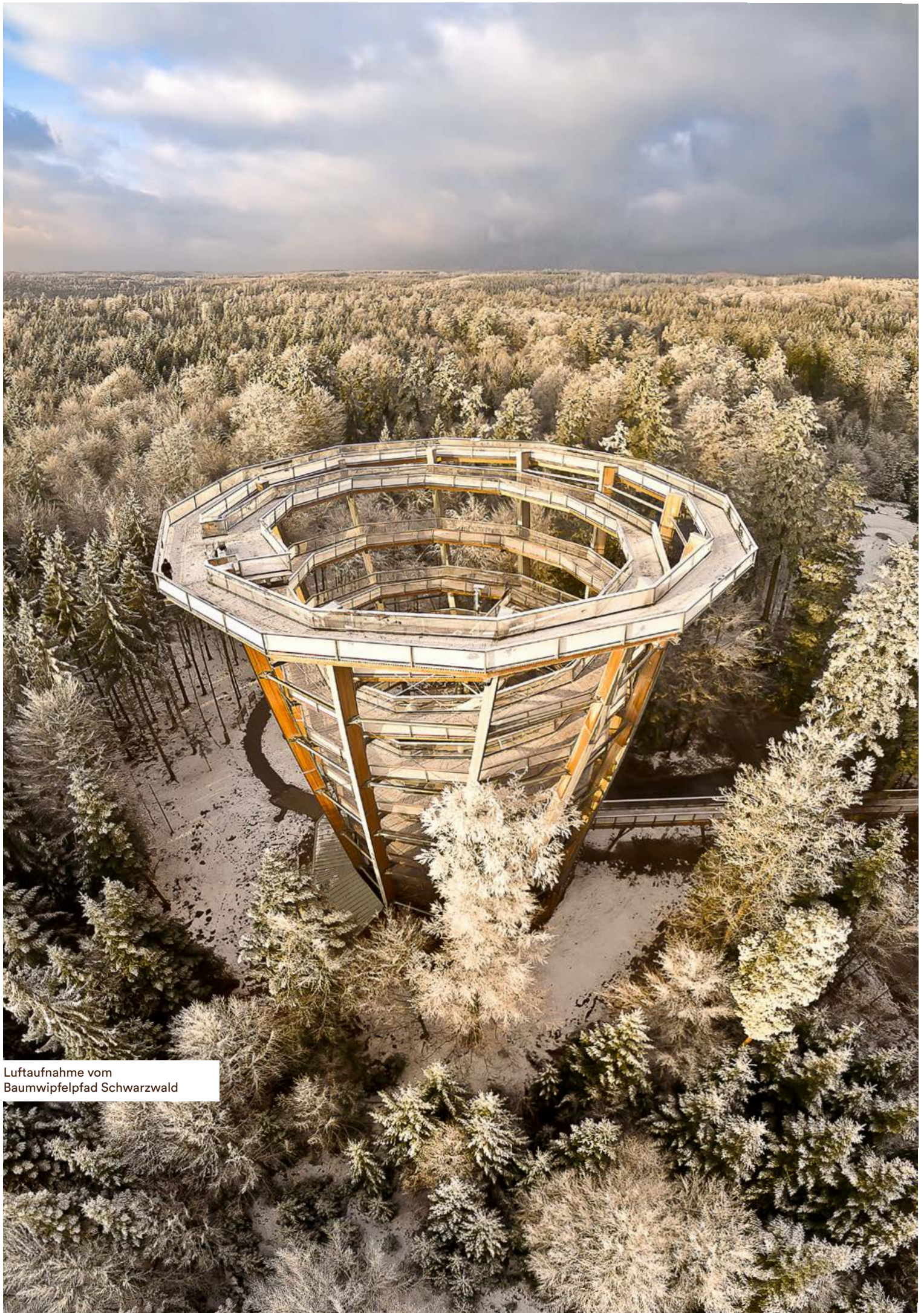
Luftaufnahme vom Baumwipfelpfad Schwarzwald